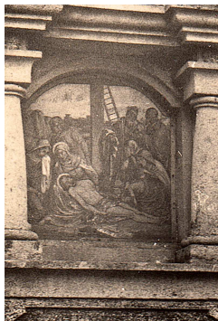
Stav obrazové výzdoby ve 30. letech 20. století

Některá ze zastavení křížové cesty ke kostelu sv. Jakuba, opravená v polovině 19. století, nesla již koncem zmíněného století stopy poškození. V roce 1897 např. Ohlas od Nežárky přinesl zprávu, že „svrchní část jedné z těchto kapliček, a to čtvrtá, jest shozena,“ a vyzýval,