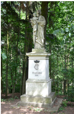
Socha sv. Josefa

klenků jednotlivých zastavení byly instalovány obrazy. Protože původní počet kapliček neodpovídá počtu zastavení, neboť již při vzniku křížové cesty byly v prvních dvou kapličkách vyobrazeny čtyři výjevy, poslední obrazy křížové cesty byly umístěny na stěnu kostela sv. Jakuba. Předlohou pro novodobé spodobnění křížové cesty se staly obrazy kunžateckého rodáka, mědiryťce a malíře Aloise Petráka, zemřelého v Jindřichově Hradci v roce 1888. Petrák absolvoval vídeňskou akademii u Josefa Führicha a ve Vídni také dlouhou dobu působil. Podle Führichových obrazů vytvořil sérii kolorovaných rytin s námětem křížové cesty a částečně ji i použil jako předlohu pro obnovu obrazů se stejným námětem v proboštském kostele v Jindřichově Hradci. Dodnes kompletně dochovaná křížová cesta signovaná malířem byla využita pro obnovu obrazů jednotlivých zastavení, když byla nafocena, vytištěna a nově umístěna do kapliček, a to i přesto, že obrazy mají viditelně jiný formát, než původní malby Josefa Scheffela.