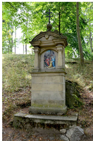
Současný stav s novou výzdobou