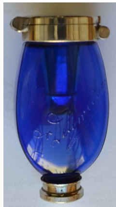
Cestovní plivátko z počátku 20. století.

chodu, kam se vypravil i se svou manželkou. Z fotografií je zřejmá jeho fascinace nejenom krajinou, přírodou a architekturou, ale především místním obyvatelstvem. V muzejním depozitáři se nacházejí i drobnosti, které nesměly chybět v zavazadle žadného správného cestovatele. Vedle řady oděvů a odvětních součástí se jedná třeba o cestovní toaletní potřeby pro dámy i pány, cestovní přístroje nebo unikátní skleněné plivátko. Dalšími zajímavostmi je třeba skládací sedátko, které je turistickou holí i židličkou zároveň. Dokladem o cestovatelské vášni především po vlastech českých jsou pak kovové štítky, které se umísťovaly na turistické hole. Ve sbírce se nacházejí jak hole se štítky, tak i volné štítky. Zvláštní kategorií jsou pak suvenýry z cest, kterých je v depozitáři také několik desítek a najdeme mezi nimi věci třeba i z daleké Číny, Indie nebo Japonska.