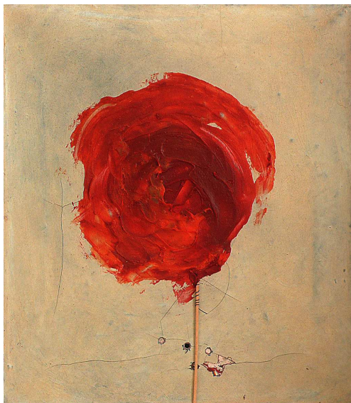
Střelnice červená, 2014, kombinovaná technika na plátně, 35x40 cm