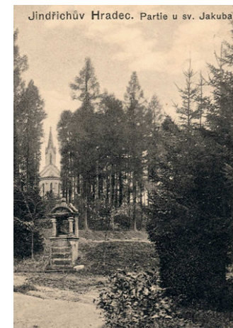
Jindřichův Hradec. Partie u sv. Jakuba.