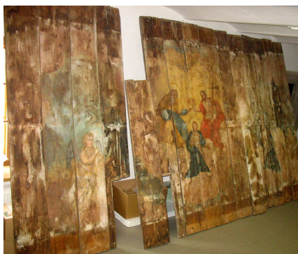
Pohled na strop před restaurováním

Sbírkové fondy Muzea Jindřichohradecka jsou každoročně obohacovány nejedním zajímavým historickým či uměleckým předmětem. K těm nejzajímavějším patří bezesporu i zákloповý strop s figurálním motivem Korunování Panny Marie malovaný temperou od neznámého malíře druhé poloviny 18. století. Přívrůstkem se stal v roce 2012, přičemž původně pocházel z domu č.p. 10 /III ve Vídeňské ulici v Jindřichově Hradci. Jedná se o velmi rozměrné dílo o celkových rozměrech 270 x 500 cm složené z dochovaných 15 prken o jednotlivé šířce 33-34 cm a tloušťce 3,4 cm. Původní počet prken byl pravděpodobně ještě vyšší, jak lze usuzovat z chybějících částí spodobněného církevního výjevu.