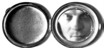
Infinity, mixed media, 1994

„Malbami větrem“ se Vladimír Merta zabývá již přes rok. Vrací se tím zpět do známých vod a rozjíždí projekt, ve kterém hraje příroda a její živly - vítr hlavní roli. Vítr je brán jako bytbatel věcí. Část již byla realizována na chalupě u Sta-