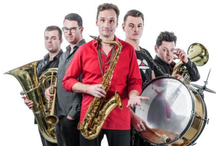
Lovesong Orchestra

V průběhu večera bude hrát v atriu semináře dlouhoruký harmonikář Ondra Vácha a poslední čtvrtinu muzejní noci se můžete těšit na zhruba hodinový koncert netradiční žesťové kapely Lovesong Orchestra, která muzejní noc rozjede v balkánském rytmu. Začátek koncertu bude ve 21.00 hodin.