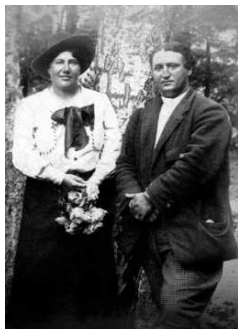
V zámeckém parku

Nová expozice přináší informaci, jak to bylo s koupí panství a zámku ve Stráži nad Nežárkou. Své divadelní prázdniny po vyčerpávajících sezónách, protkaných četnými koncerty v amerických i evropských městech, měla Ema Destinnová ve zvyku trávit v Čechách. Chtěla si zde, vzdálena ruchu velkoměst, v kruhu svých blízkých odpočinout a nabrat nových sil do další umělecké práce. Vybírala si především prostředí českého venkova, kde se mohla uprostřed přírody oddávat své velké vášni – rybaření.