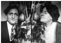
Šťastný zámecký pár