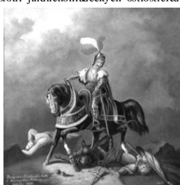
Jiří z Poděbrad na jednom z malovaných ostrostřeleckých terčů