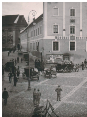
Za mobilizace v J. Hradci srpnu 1914