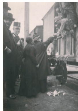
Na nádraží v J. Hradci v srpnu 1914

Výstava po stručném úvodu o válce a historii pěšího pluku č. 75 zachycuje působení pluku od mobilizace a odjezdu vojáků z Jindřichova Hradce na frontu v červenci a srpnu 1914, přes působení pluku na východní frontě v Haliči, dlouhý přesun na jižní bojiště po bitvě u Zborova v létě 1917 a osudy pluku na italské frontě až po život náhradního praporu, který od listopadu 1915 v Debrecíně připravoval mobilizované, odvedené a zraněné vojáky pro další boje na obou frontách. Na mnohdy unikátních fotografiích tak návštěvníci výstavy v konferenčním sále muzea ve Štítného ulici mohou alespoň trochu nahlédnout do událostí, které před sto lety museli prožívat muži v uniformách rakousko-uherské armády.