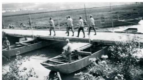
Na ruské frontě v létě 1916

Požívání dokumentárních snímků na frontách bylo v té době samozřejmě ovlivněno jak technickou úrovní a vybavením fotografujících vojáků, tak jejich možnostmi, které byly za válečné situace velmi omezené. To nutně muselo poznamenat nejen řemeslnou, ale také výtvarnou úroveň některých snímků, zejména těch amatérských, které byly zhotoveny ve velmi malých formátech a někdy nesou zřetelné stopy po nedokonalém vyvolání či ustálení hotových fotografií a je na nich patrné i jejich stoleté stáří. Přesto jsou výmluvným a jedinečným svědectvím o kruté době a těžkém životě příslušníků 75. pěšího pluku za první světové války, a proto po nezbytných úpravách, které dnešní digitální technika umožňuje, tvoří hlavní část výstavy nazvané Momentky z války.