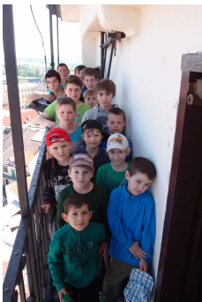
Chlapci do 15 let po vyběhnutí na věž v roce 2015

Oblíbená sportovně-zábavná soutěž o nejrychlejšího běžce do 153 schodů městské vyhlídkové věže se koná v sobotu 14. května od 9.00 hodin. Závodníky začneme zapisovat do startovních listin v 8.30 hodin. V letošním roce je naše soutěž zařazena do projektu Jihočeského kraje Jižní Čechy olympijské, takže se připravujeme na větší zájem účastníků, který očekáváme díky větší reklamě, kterou projekt má.