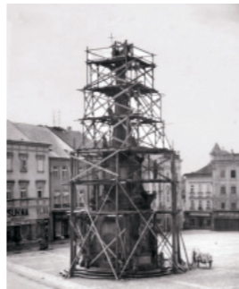
Oprava v roce 1940

Když bylo koncem 30. let 20. století konstatováno,