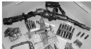
Fragmenty z kulometu MG-131/13, munice ráže 13 x 20 mm, torzo letecké mapy včetně modelu Fw 190 stroje Fw. Huberta Engsta v expozici.

Nejnovější odborné analýzy nás vedou k hypotéze, že vykopaný Fw 190 nebyl verzí A-8, ale verzí starší, o něco lehčí, méně pancéřovanou, se slabším zbraňovým systémem. Takový stroj mohl dokonale ovládat a užívat pouze zkušený stíhač, jakým byl jeho pilot Fw. Herbert Engst od 6. letky II. (Sturm)/JG 300 „Wilde Saar“, který přežil svůj sestřel u Otína. V expozici je k vidění např. torzo dvouhvězdicového čtrnácti-