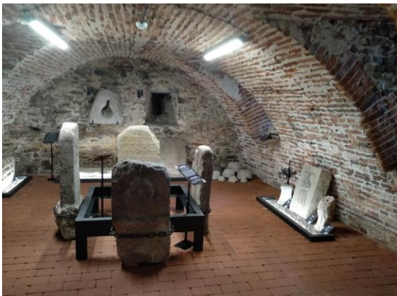
V září byla slavnostně otevřena nová expozice kamených artefaktů s názvem Historie vytesaná do kamene.

Děkuji jménem všech pracovníků muzea všem osobám a institucím, které naše muzeum v uplynulém roce 2020 nějakým způsobem podpořily.