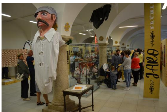
Vernisáž výstavy Tradice jedné hranice ve výstavním sále „Ve Svatojánské“ proběhla až v červenci.

Problémy byly trojího rázu – ekonomicko-provozního, odborného a personálního; dotkly se tak činnosti muzea ve všech jejích hlavních aspektech. Lidsky nejbolestivější byly zcela jistě problémy personální.