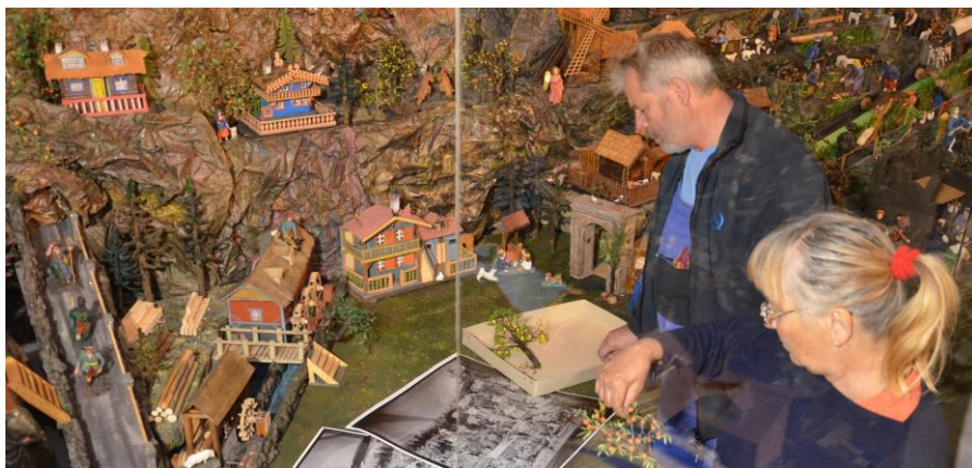
Doba, kdy bylo muzeum uzavřené, byla využita k rekonstrukci Krýzových jeslíček.