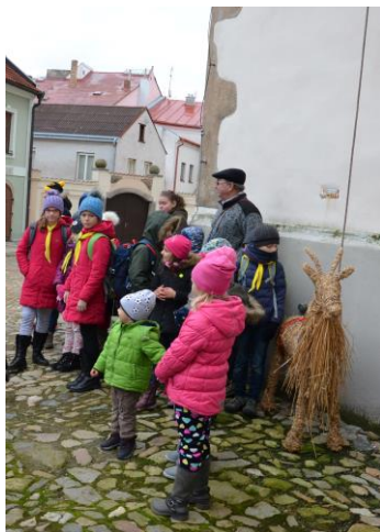
Již tradiční betlemářský festival Jindřichohradecké JInoHRÁtky zahájilo v sobotu 30. listopadu spouštění "hlásné" kozy z věže