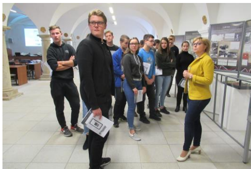
Během Týdne knihoven proběhla řada programů pro základní a střední školy