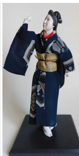
Panenko ze sbírky ED před a po restaurování

Vedle biedermeierovských dámských měšťanských kabátků a čepečků, dětských kojeneckých čepečků a ženských soukenných kabátků „špenzrů“ patřily k nejzajímavějším dva kabátky ze slavnostní postilionské uniformy z poloviny 19. století.