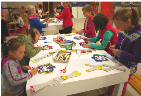
Výtvarné dílny k výstavě Japonské hračky, děti vyrábí jednoduché hýbací loutky a masky

z malířů“. Na výstavě Kauckého obrazů upoutala hosty muzea mimo jiné série portrétů městských a okresních starostů. Muzeum si dovolilo v této souvislosti učinit neformální návrh, aby tyto obrazy jako dlouhodobé zápůjčky vytvořily základ galérie jindřichohradeckých starostů v reprezentační místnosti na staré radnici.