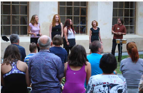
Vokální soubor X-TET při letním koncertu v rajsském dvoře minoritského kláštera

Drobným potěšujícím úspěchem byla výstava hraček Merkur ve výstavní síni Ve Svatojánské, která vrátila několik tisíc nadšených dospělých návštěvníků do dětských let. Zajímavé je, že tyto hračky zaujaly i děti, byť v nich nebylo ani stopy po moderních informačních technologiích. K úspěchu výstavy bezesporu přispěla možnost něco si osobně postavit, čehož využila naprostá většina návštěvníků.