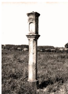
Boží muka v Radouňce v roce 1967 (5)

Jindřichohradecká sloupovitá Boží muka se dají dnes najít na několika místech při okraji města. Jejich největší kumulace je podél levé strany cesty na Radouňku. První z nich v podobě toskánského sloupu se čtyřhrannou hlavicí bez výklenků jsou zakončena stříškou s koulí na vrcholu. Nalézají se ještě v zástavbě v ulici Na Kopečku u č.p. 151 (3). O několik desítek metrů dál stojí další Boží muka pocházející z roku 1601 (4). Byla vytvořena v přechodném renesančně-barokním stylu. Na sloupu o čtvercovém půdorysu se skosenými hranami s vytesaným jménem Marcus Raus se nachází hlavice s výraznou třístupňovou římsou a výklenky. Poslední z této trojice stojí na samém okraji Radouňky (5). Na osmibokém sloupu je umístěna jednoduchá čtyřboká hlavice s reliéfy s lebkou a zkríženými hnáty nad jednotlivými výklenky. Na vrcholové římsě byl druhotně vztyčen jednoduchý kovový křížek.