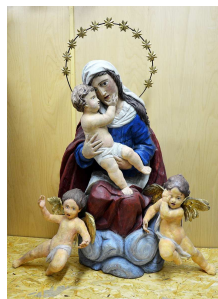
Sousoší Panny Marie s anděly