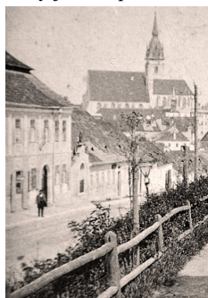
Václavská ulice před požárem v roce 1902

Původně bylo v kapli umístěno dřevěné sousoší Panny Marie s Jezulátkem a s andělky po stranách, které stylově pochází ze stejné doby jako kaplička. Socha Madony i andělci jsou vyřezáni ze dřeva