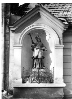
Opravená kaplička sv. Jana Nepomuckého