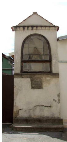
Současná podoba kapličky v Kmentové ulici