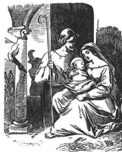
Otisk původního štočku z jindřichohradecké Landfrasovy tiskárny

MUZEUM JINDŘICHOHRADECKA VÁM PŘEJE HODNĚ ŠTĚSTÍ, ZDRAVÍ, LÁSKY A MNOHO ŠTASTNÝCH DNŮ V NOVÉM ROCE 2024.