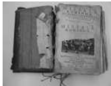
Původní stav misálu (1651)