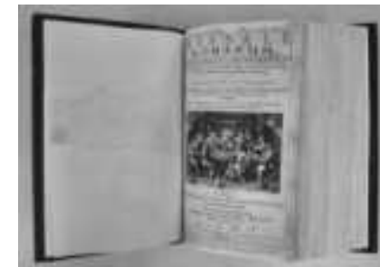
Nově restaurovaný misál

města. Třetí restaurovaný tisk představuje bohatě typograficky vypravenou podobu latinského misálu tištěného v roce 1651 v Antverpách. Návštěvníky zaujaly především celostránkové mědirytinové výjevy ze života Ježíše Krista a precizní červenočerný tisk misálu včetně notových záznamů písní.